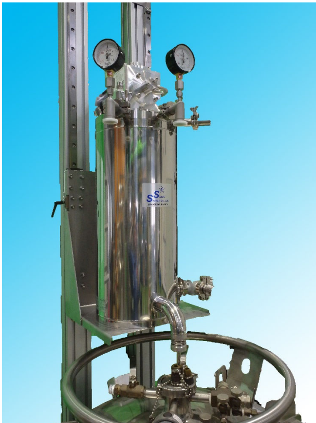
使用例: デュワーに設置されたヘリウム再凝縮装置

仕様の変更につきましてはご相談に応じて検討いたします。 上記数値は予告無く変更することが御座います。ご了承ください。